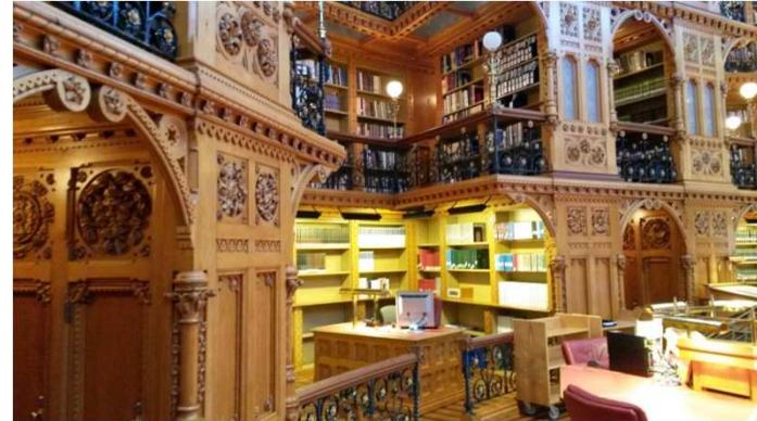
et sa bibliothèque