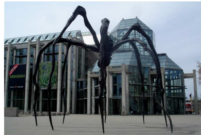
musée d'art moderne et des civilisations