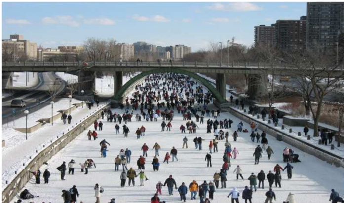
Le rideau canal