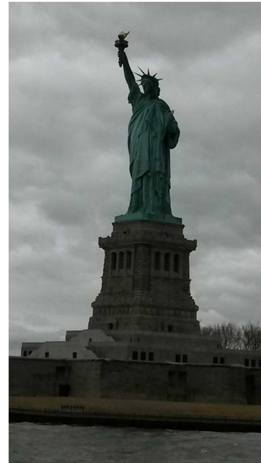
La Statue de la Liberté